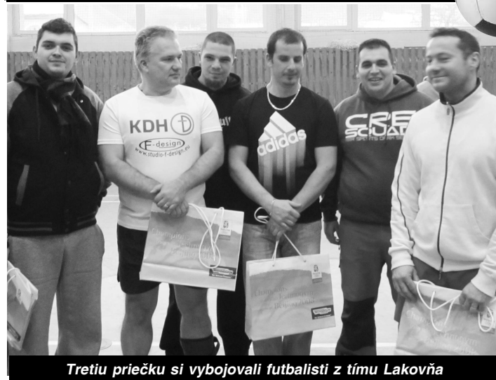
Tretiu priečku si vybojovali futbalisti z tímu Lakovňa