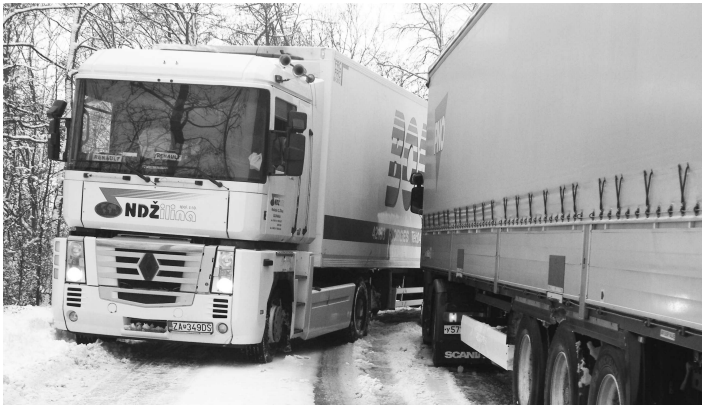
Na šmykľavej ceste si krížujúce kamióny museli počkať na pomoc cestárov

Silné sneženie, najmä v pondelok a v utorok ráno, potešilo najmenších i priaznivcov zimných športov, starosti však pribudli dopravcom, prepravcom, vodičom i cestárom. Sneženie narobil problémy v cestnej doprave na celom Slovensku. Viaceré horské priechody a úseky ciest boli aj niekoľko hodín nezjazdne a ani v obciach a mestách to nebolo najlepšie. Vítaným pomocníkom viacerých vodičov bola lopata, lebo si z parkovacích miest alebo spred garáží museli najskôr odpratať sneh, ak chceli vyjsť.