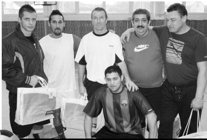
Finálové brány turnaja uzreli aj hráči Black Stars, museli sa uspokojiť so striebrom