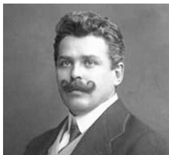
Prof. MUDr. Jan Janský - (3. 4. 1873,- 8. 9. 1921.)

bol český neurológ a psychiater. Ako jeden z prvých opísal delenie ľudskej krvi na štyri základné krvné skupiny I, II, III a IV. Toto rozdelenie najprv predniesol v novembri 1906 v Spolku českých lekárov a neskôr v roku 1907 publikoval v "Sborníku klinickom" pod názvom "Hematologická studie u psychotiků". Toto rozdelenie však