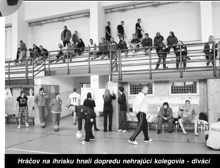
Hráčov na ihrisku hnali dopredu nehrajúci kolegovia - diváci