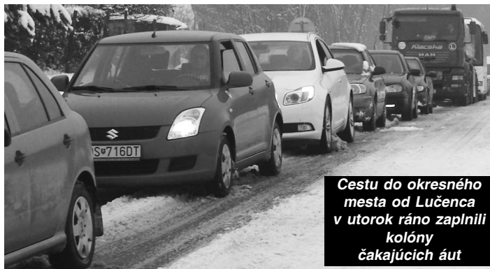
Cestu do okresného mesta od Lučenca v utorok ráno zaplnili čakajúcich áut