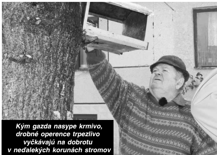
Kým gazda nasype krmivo, drobné operence trpezlivo vyčkávajú na dobrotu v neďalekých korunách stromov

Š. Imre: "Často si sadnem v kuchyni k oknu a sledujem ako vtáčiky na dvore šantia. Niekedy sa ich na dvor zlietne aj okolo dvesto. Prilietavajú, odlietavajú a zvädzajú súboje o najlepšie miesta pri krmidle. Sledujem aj ich spôsob pri krmení. Napríklad sýrkorky uchytiť semiačko a odletia, naopak strnádky vylúskajú