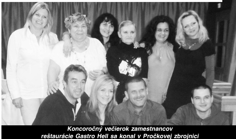
Koncoročný večierok zamestnancov reštaurácie Gastro Hell sa konal v Pročkovej zbrojnici