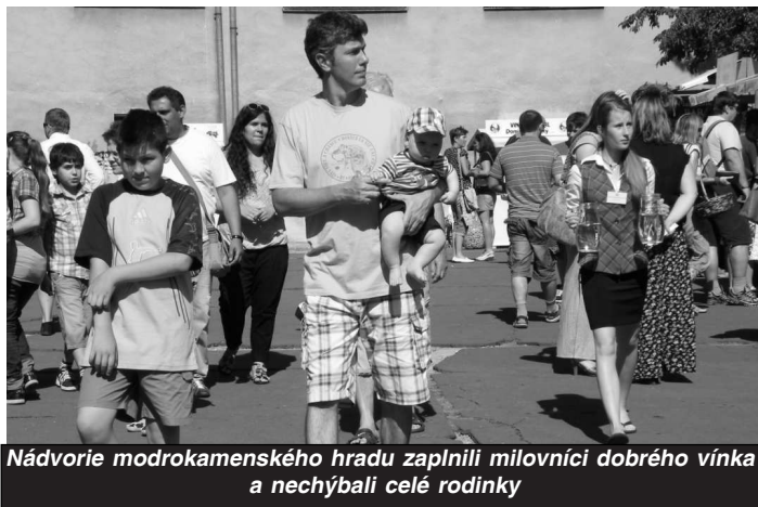
Nádvorie modrokamenského hradu zaplnili milovníci dobrého vína a nechýbali celé rodinky

● Toto podujatie je o víne z nášho regiónu. Vy osobne konzumujete víno, a ak áno, akému druhu dávate pred-