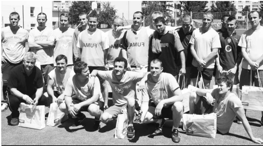
Ocenené tímy: 1.miesto Kvalita, 2.miesto Lakovňa a 3.miesto Bubáci