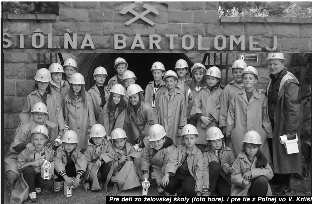
Pre deti zo želovskej školy (foto hore), i pre tie z Poľnej vo V. Krtíši ostanú spomienky na čarovný týždeň zo školy v prírode určite dlho v pamäti

v štyroch krúžkoch. V športovom si zahráli futbal, basketbal, volejbal ako aj pre deti najzaujímavejší florboll. Veľmi atraktívny bol krúžok zálesácka šupa, v ktorom deti prebádali okolie školy, spoznávali živočíchy a rastliny, objavovali tajie prírody, stavali bunkre, mosty... V krúžku pod názvom art park si rozvíjali estetické čítanie, spojili výtvarné umenie s prírodou. V poslednom "babskom" krúžku sa dievčatá menili na modelky, tanečníčky.