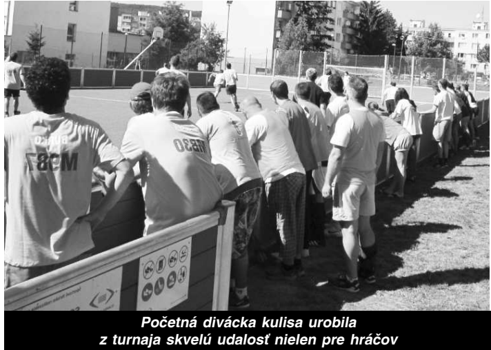
Početná divácka kulisá urobila z turnaja skvelú udalosť nielen pre hráčov

Po náročných dueloch sa oddychovalo, kde sa len dalo ☺