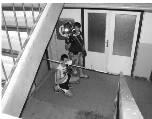
Príčina pádu mladého muža do schodiskového zrkadla bola v čase našej uzávierky neznáma

Lekári začali okamžite zisťovať rozsah jeho zranení. Urobili mu všetky vyšetrenia, CT - vyšetrenie a uviedli ho do stabilizovaného stavu. Podľa informácií na druhý deň ráno bol mladík stále v kritickom stave. Viac sa k zdravotnému stavu lekári nechceli vyjadrovať, ale ako sme sa po