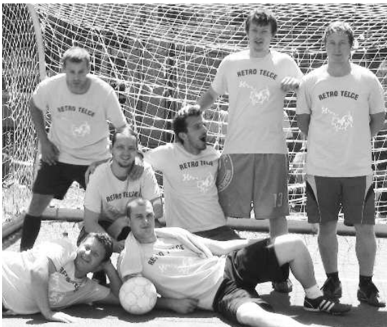
Víťazný tím KVALITA mal názov hodný svojho výkonu

Prekvapením pre všetkých súčasne v prvom ročníku Futbalového turnaja o Putovný pohár riaditeľa závodu bolo usporiadanie posedenia pri guláši. Vyčerpaní ale spokojní a športovo "vyžití" hráči a organizátori sa teda presunuli do príjemného prostredia a vydarený prvý ročník Futbalového turnaja Technogymu sa mohol skončiť. S dobrým pocitom u víťazov i porazených, a takisto so spokojnosťou organizátorov.