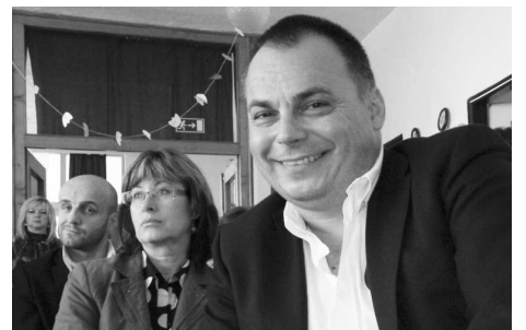
Pozvaní hostia sa zúčastnili osláv 40. výročia založenia CPPPaP vo V. Krtíši